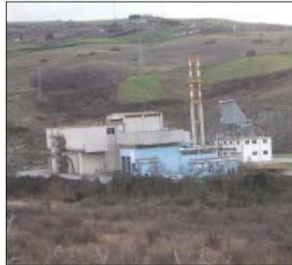
L'inceneritore di San Luca Branca

La Fp Cgil ricorda che quel provvedimento «licenziato in tempi celeri era la base sui cui partire al fine di consentire alla città di Potenza di avere una propria impiantistica di base da mettere a disposizione di tutti i 26 comuni del bacino centro». Ma nel frattempo non si è mosso molto: «L'amministrazione - continua la nota del sindacato - non ha posto la dovuta attenzione su un'operazione che avrebbe comportato un risparmio di