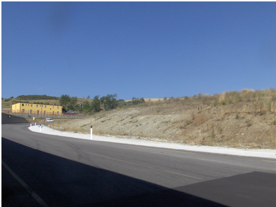
Area proposta per la Piantumazione