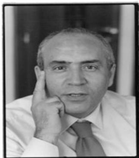
Commiss.dal 2010 al 2014