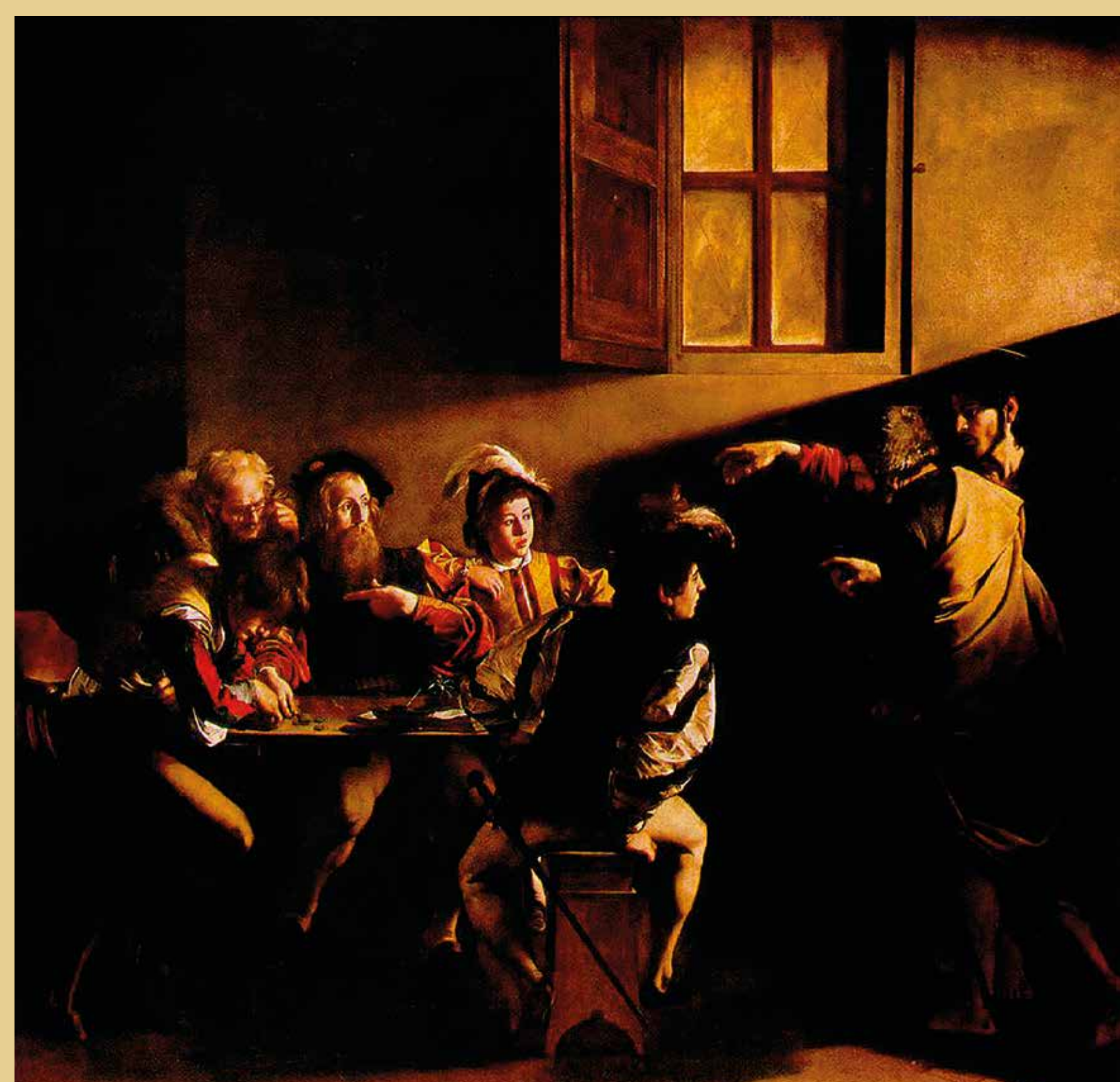
Vocazione di San Matteo